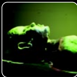
צילום מתוך תהליך העבודה: איתי ויזר